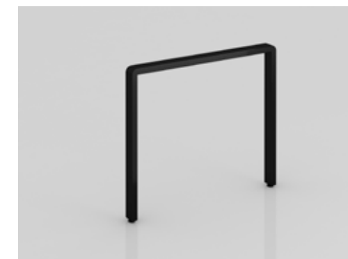
plataforma pedestal trave