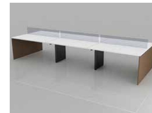
plataforma pedestal painel