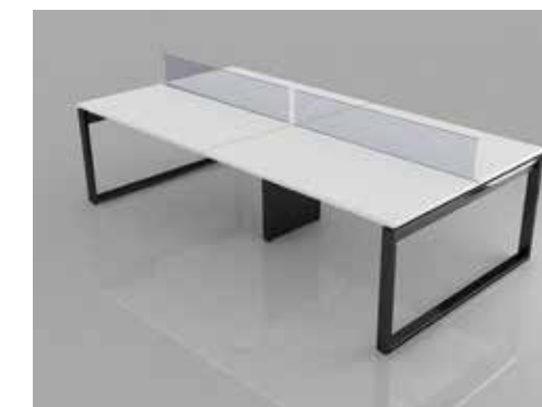
plataforma pedestal quadro